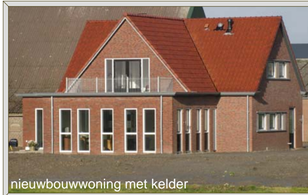
nieuwbouwwoning met kelder

Bouwen kán leuk zijn, als voorbereiding en uitvoering goed op elkaar zijn afgestemd. Daarom heeft Casa Ratsma het draaiboek bouwen moet leuk zijn ontwikkeld. Het beschrijft de stappen van de voorbereiding tot en met de oplevering en biedt hulpmiddelen om deze stappen zorgvuldig en in de juiste volgorde te zetten. Al snel weet u precies hoe uw woning er uit gaat zien en of hij past op de plek waar u gaat wonen. Zo helpt Casa Ratsma u uw droomhuis te realiseren.