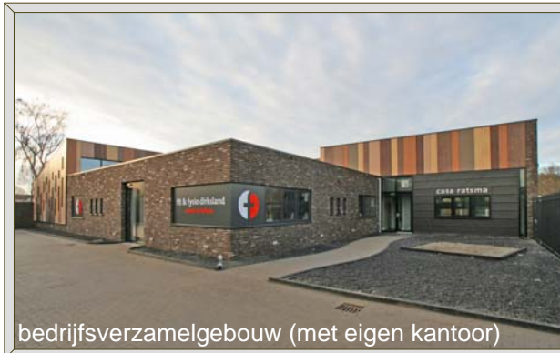
bedrijfsverzamelgebouw (met eigen kantoor)