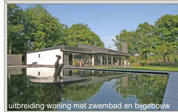
uitbreiding woning met zwembad en bijgebouw

Daarom heeft Casa Ratsma het draaiboek (ver)bouwen moet leuk zijn ontwikkeld. Het beschrijft de stappen van de voorbereiding tot en met de oplevering en biedt de hulpmiddelen om deze stappen op de juiste wijze te zetten. Casa Ratsma helpt u daarbij waar (en zolang) u het wilt.