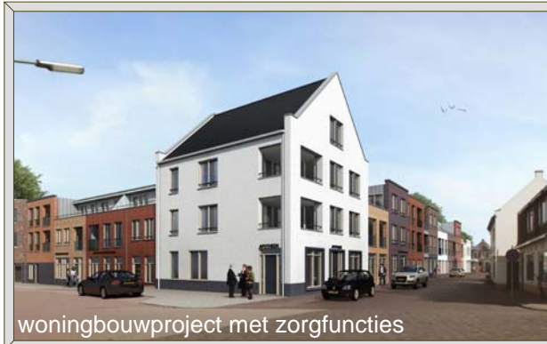
woningbouwproject met zorgfuncties

Voor dit soort vraagstukken heeft Casa Ratsma het concept Casa Nova ontwikkeld. Dit concept biedt vanaf het eerste initiatief visuele hulpmiddelen om uw project (tegen beperkte kosten) een verleidelijk gezicht te geven. Casa Ratsma zorgt dat alle stappen van de vroege voorbereiding tot en met de oplevering doorlopen worden, loodst het project door de diverse procedures en biedt de flexibiliteit om uw plan later (samen met de eindgebruikers) verder uit te werken.