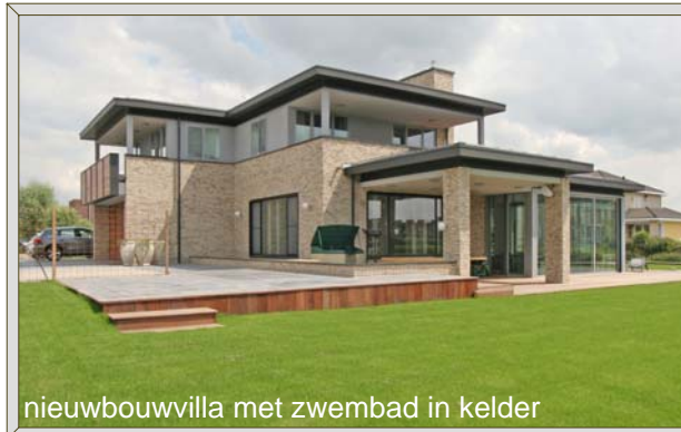
nieuwbouvilla met zwembad in kelder