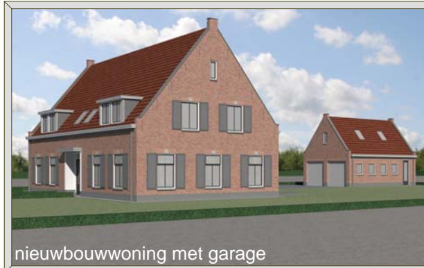
nieuwbouwwoning met garage